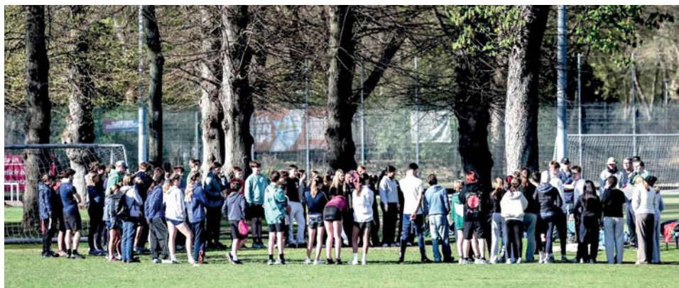
Ultimate Jamboree – Tag 3