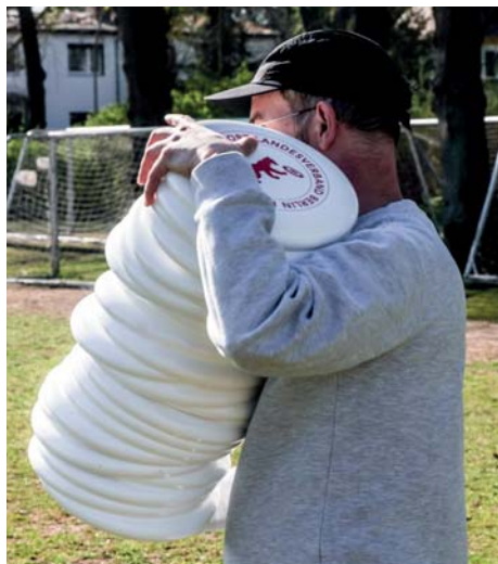
Ultimate Jamboree – Tag 2

Die Gemeinschafts-AG trifft sich nun jeden Mittwoch auf der Werferwiese im Stadion Lichterfelde. Interessierte Schülerinnen und Schüler von Lichterfelder/ Steglitzer Oberschulen können sich weiterhin ganz einfach selbst für die AG mithilfe des Anmeldeformulars anmelden. Die Formulare können die Teilnehmenden über die ihre Klassen- beziehungsweise Sport-