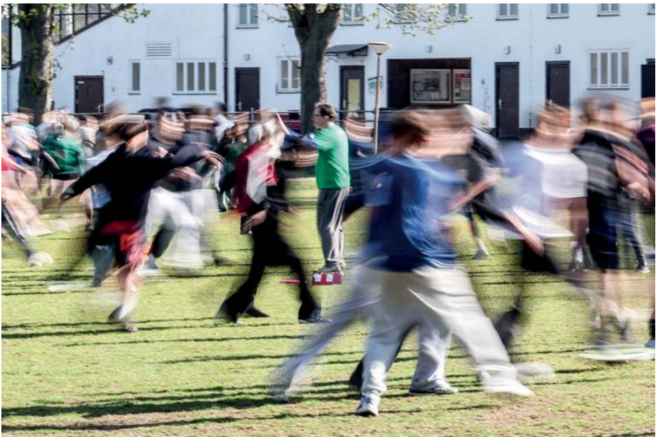
Ultimate Jamboree – Tag1

Besondere Aufmerksamkeit erhielt erneut der „Spirit of the Game“-Preis, der im Ultimate Frisbee traditionell eine zentrale Rolle spielt. Die ausgezeichnete Mannschaft durfte sich über Frisbeescheiben freuen, die vom Frisbee-Landesverband Berlin gestiftet wurden.