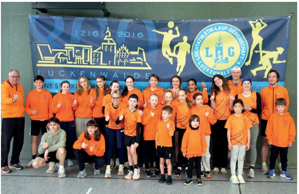
Seriensieger der Vereins Gesamtwertung wird der TuS Lichterfelde e.V.