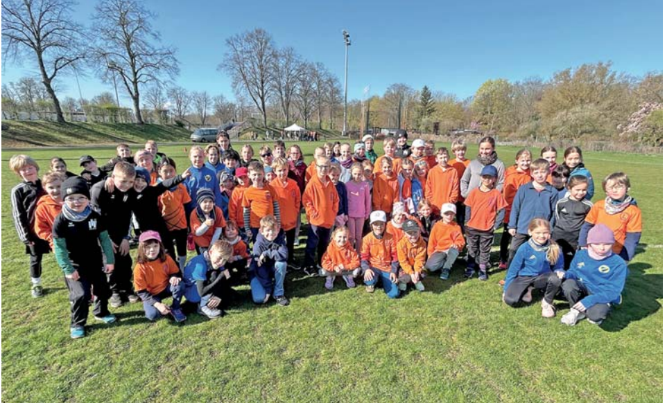
Großes Interesse herrschte beim 1. TuS Li Kinder Wufcup 2026