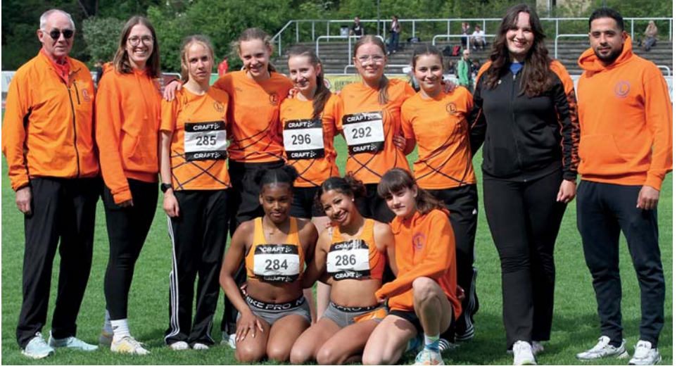
Weibliches U16-TEAM mit ihren Trainerinnen und Trainern

zur Erfüllung der DM-Norm. Nach 2025 (Platz 3) brachten wir 190 Punkte weniger zusammen uns kamen hinter dem LAC Berlin auf 9.267 Punkte.