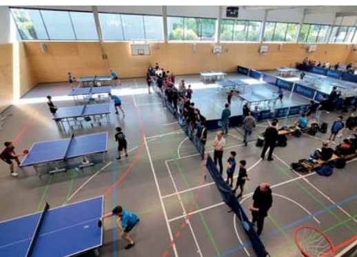
Volle Halle mit 80 Teilnehmenden bei BfD-Abschlussprojekt