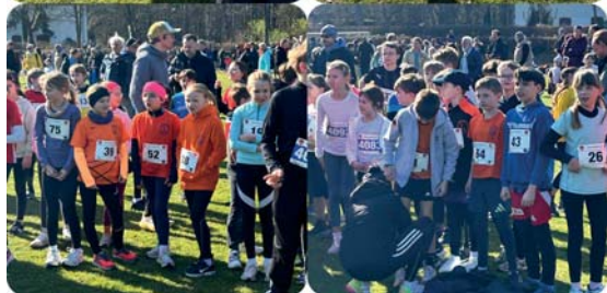
Großes TuS Li Aufgebot beim Jubiläumslauf in Frohnau