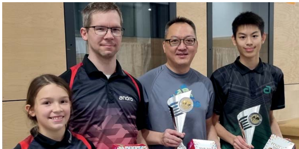
Sieger*innen Weihnachtsturnier.