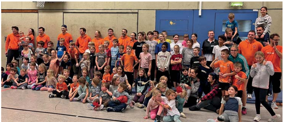
Ein tolles TEAM die TuS Li-Leichtathleten

Zum Abschluss durfte jedes Kind in Sack des Nikolaus greifen und eine Überraschung und eine süßes Weihnachtsandenken mit nach Hause nehmen.