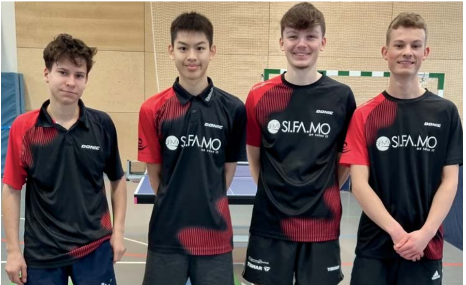
1. Jungen U19.