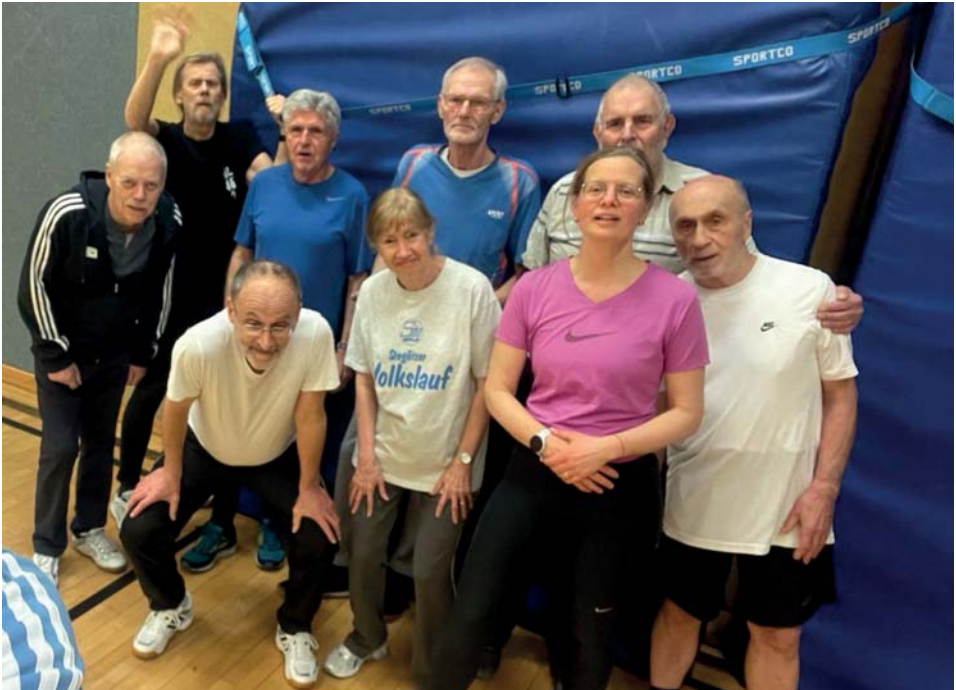
Unsere jung gebliebenen Senioren Leichtathleten