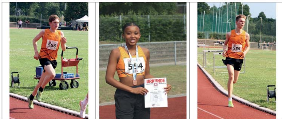
So kann man resümieren: Drei Athleten – Drei Medaillen!