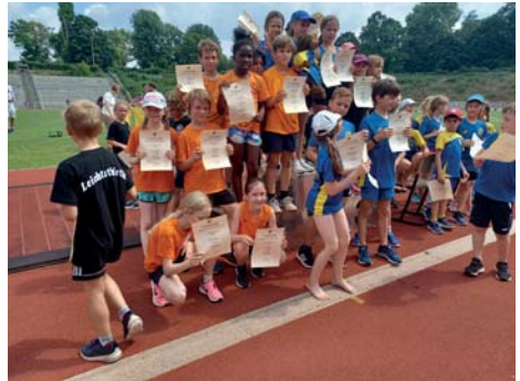
Strahlende Gesichter beim BLV KILA-Cup

Bei den TuS Li Hurrikans der Altersklasse U12 haben neben unseren TuS Li TEAM nur noch die Sportfreunde Kladow an allen bisherigen KILA-Cup Durchgängen teilgenommen. Beim Einarmigen Stoßen des 2 kg Medizinballs kam unser Team auf Platz 3 und beim 50 m Hindernislauf, der 6 x 400 Staffel, 6 x 50 m Staffel und