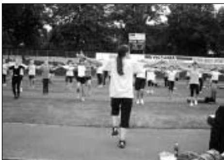
2:2 im Gleichgewicht: Feriengymnastik 2006