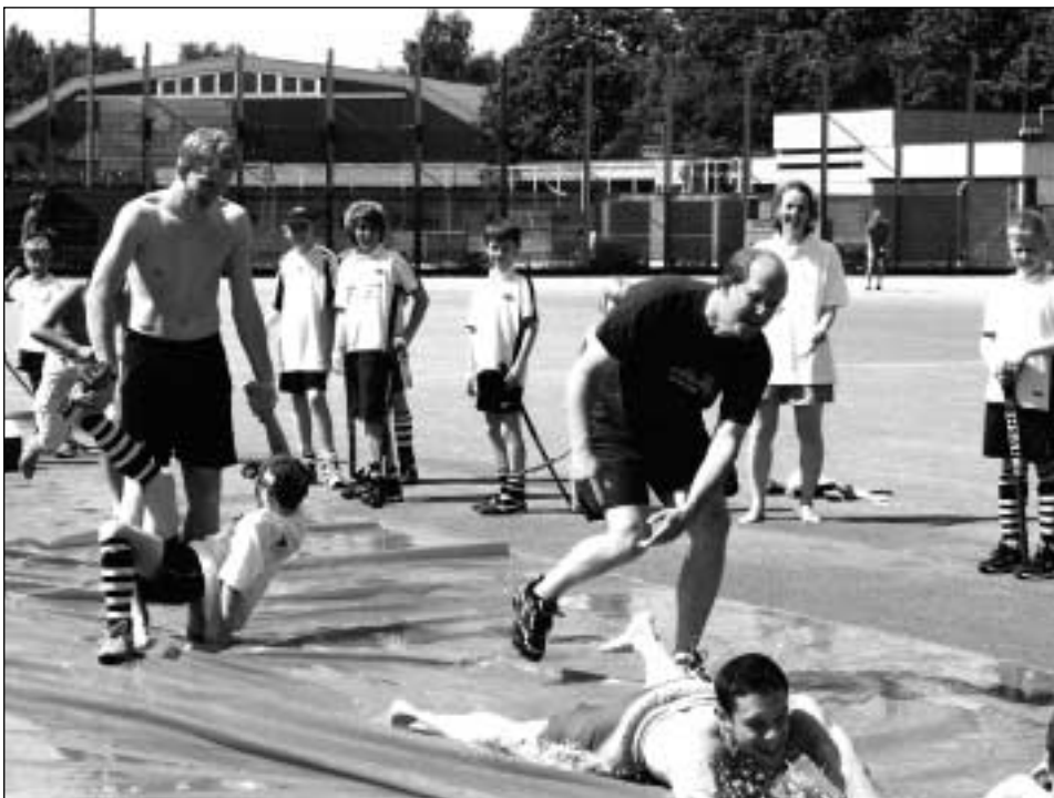
Sommerfest 2006: Da wird jemand ganz schön nass gemacht...