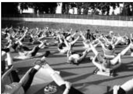
Da legst di nieder: Feriengymnastik 2006