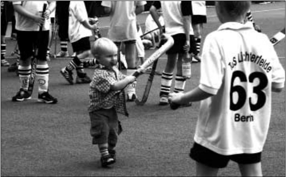
Sommerfest 2006: Früh krümmt und schlägt sich...